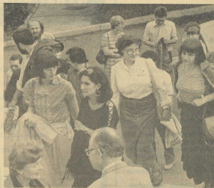
Erkeznek a vendégek a Pécsi Akadémiai Bizottság székházához.

Délután a delegáció Krasznai Antal, a Hazafias Népfront Baranya Megyei Bizottságának titkára társaságában a bogádi termelőszövetkezetbe látogatott.