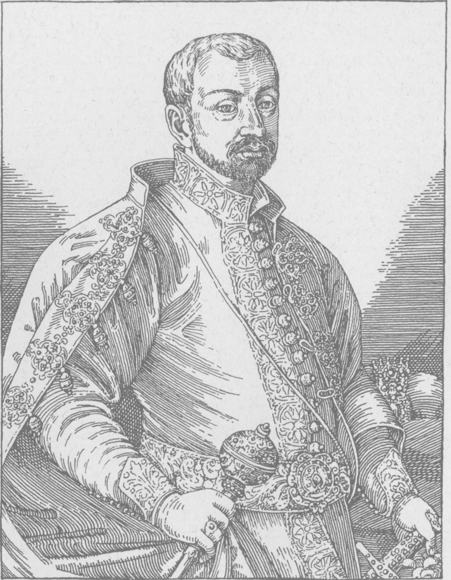
FRANCISCVS BALASSA DE GYARMATH ÆTATIS SVÆ XXIX.