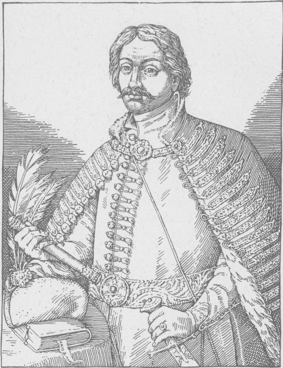
VALENTINVS BALASSA DE GYARMATH ÆTATIS SVÆ XXXIII.