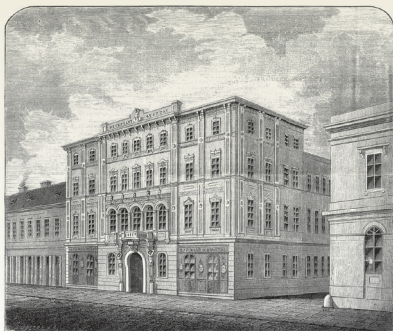
A képen a még Heckenast Gusztáv által építtetett Egyetem utca 4. szám alatti épület látható, amelyben a Vasárnapi Ujság szerkesztősége és kiadóhivatala, valamint nyomdája is működött.

A szélesebb közvélemény Schöpflin Aladár nevét-tevékenységét a Nyugathoz kapcsolja, jó okkal: ott közölt tanulmányaiból és kritikáiból eddig három válogatás jelent meg, Komlós Aladár, Réz Pál, illetve Schöpflin Gyula szerkesztésében. Egyikben sem kapott helyet egyetlen, a Vasárnapi Ujságban megjelent névtelen kritikája sem. Pedig Schöpflinnek közel 2000 (!) rövid recenziója jelent meg a hetilapban, amelyekről Horváth János már 1913-ban rögzítette: „megállapítandó szép érdeme, hogy az elfogult vagy érdeklődést hazudó, pajtáskodó és sokszor rosszhiszemű ipari, üzleti hírlapi kritikák mai csúf korában egy hetilapunk hasábjain már évek óta finom érzékkel, művelt ízléssel, tisztos modorban, mindenkor komoly irodalmi színvonalon ismerteti s bírálhatja a napi irodalom termékeit. Az ő névtelen cikkecskéi támpontjai lehetnek egy majdani összefoglalásnak.”